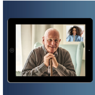
Bild & texttelefoni

TERA samlar vanlig telefoni, bildtelefoni och texttelefoni i en och samma app. Den unika kombinationen av AI-baserad autotextning (tal-till-text), talsyntes (text-till-tal), video och vanlig Realtidschatt gör det möjligt att kommunicera och ta del av information på samma villkor som alla andra.